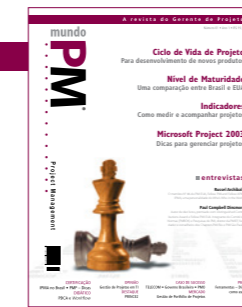
Número 01 • Ano 1